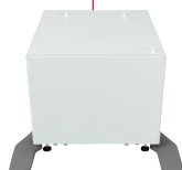
4. MX-DS22N Unterschrank