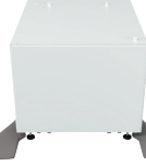
4. MX-DS22N Unterschrank